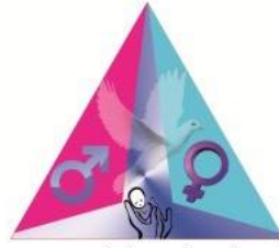
Triangle (တြိ)အမျိုးသမီးအဖွဲ့.