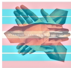
Transmen Association Myanmar