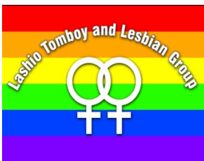
Lashio Tomboy and Lesbian Group(LTLG).