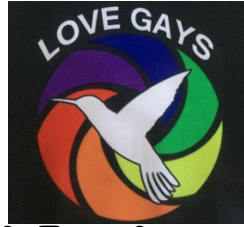
ချယ်ရီမြေမှတူညီသောလက်များ.