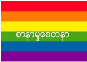
စာနာမှုစေတနာ.