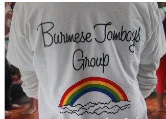
Burmese Tomboy Group