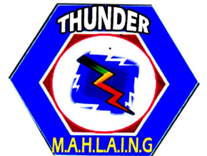
မလှိုင်သန်းဒါ