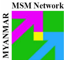
Myanmar MSM TG Network

မိတ္ထီလာဒေသ-လိင်စိတ်ခံယူမှုကြွေးသူများကွန်ယက်