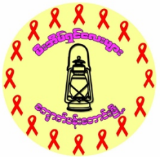
မီးအိမ်ရှင်လေးများ.